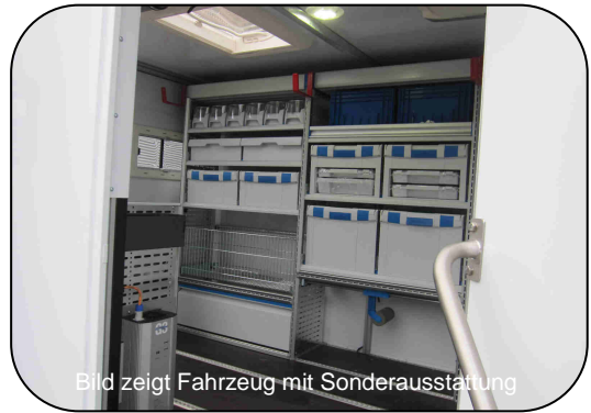
Bild zeigt Fahrzeug mit Sonderausstattung