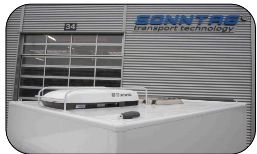
Heiz- und Klimagerät