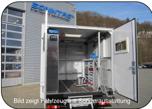
Bild zeigt Fahrzeug mit Sonderausstattung